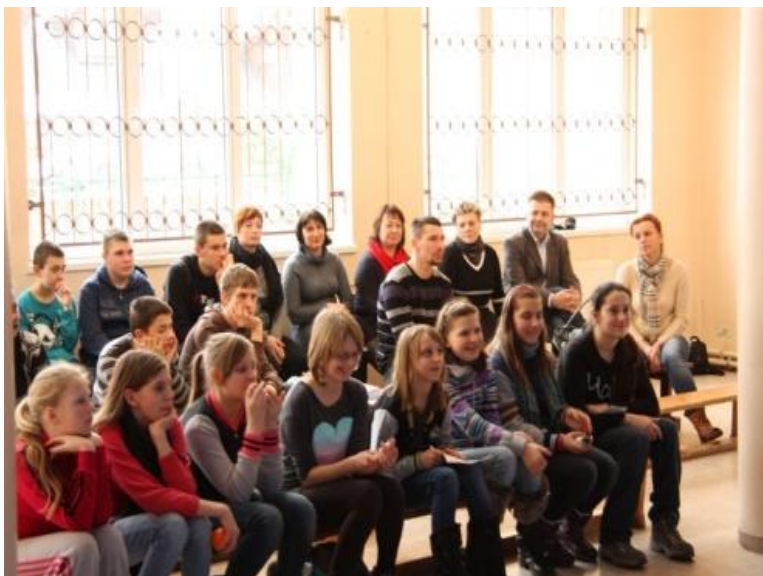
Wymiana partnerska Smołdzino