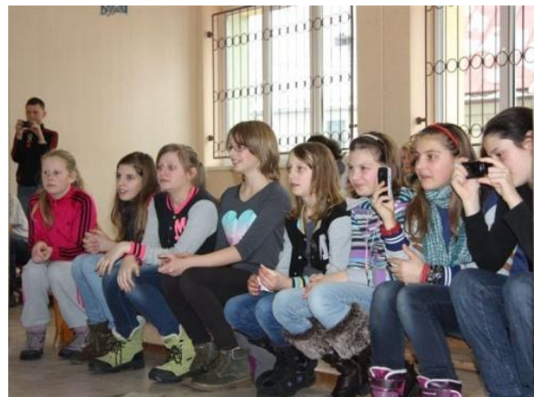
WYMIANA PARTNERSKA Z GMINĄ SMÓLDZINO Str. 3