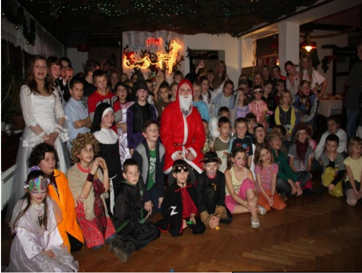
Bal w Sosnowce