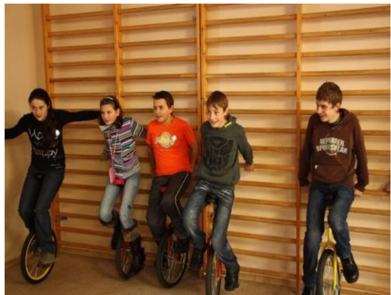
Wymiana partnerska Smołdzino