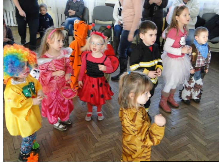
Bal w Sosnowce