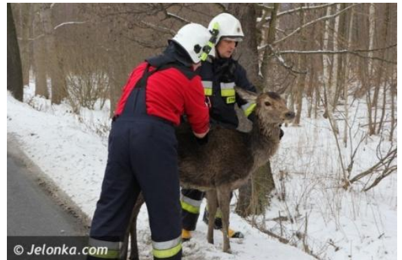
RATOWALI DZIKIE ZWIERZĘTA Str. 14