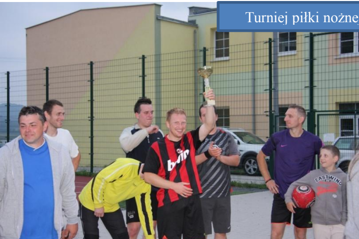
Turniej piłki nożnej na Orliku w Sosnowce