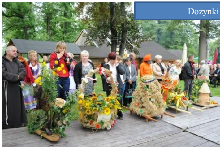
Dożynki Gminne 2013