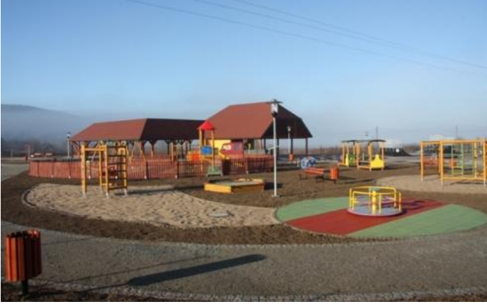
Centrum Aktywności Sportowej i Integracji Społecznej „Sosnówka” w Sosnowce