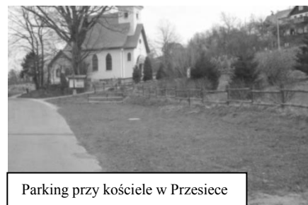
Parking przy kościele w Przesece

sprzętu sportowego do Domu Kultury „Ekran” w Miłkowie, doświetlenie dróg w Sosnowcu, Stanisławowie oraz Głębocku, zagospodarowanie parkingu w Przesece,