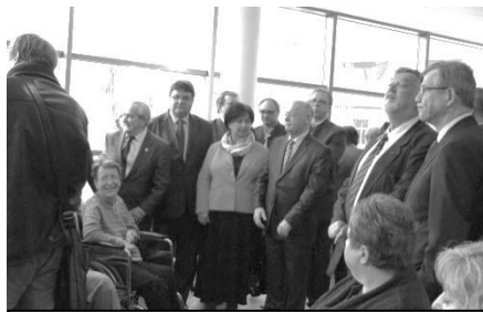
Uroczyste otwarcie Warsztatu Terapii Zajęciowej

Wójt Gminy informuje, że osoby niepełnosprawne z terenu gminy Podgórzyn mogą korzystać z Warsztatu Terapii Zajęciowej, który mieści się w obiekcie Centrum Integracji i Tradycji Miasta Kowary, przy ul. 1 Maja 1a (I piętro). Zajęcia odbywają się w kilku