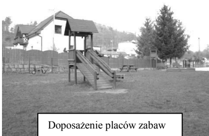
Doposażenie placów zabaw

zagospodarowanie placów zabaw w Sosnowcu oraz Ściegnach, zakup urządzeń zabawowych na place zabaw w Podgórzynie oraz Ściegnach,