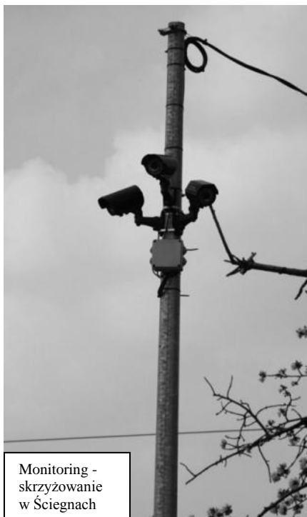
Monitoring - skrzyżowanie w Ściegnach

wykonanie monitoringu skrzyżowania dróg w Ściegnach,