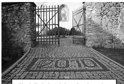
Chodnik do kościoła w Stanisławowie

założenie monitoringu przy Młodzieżowym Schronisku Turystycznym w Stanisławowie, wykonanie spowalniaczy drogowych w Borowicach, wykonanie chodnika do kościoła w Stanisławowie,