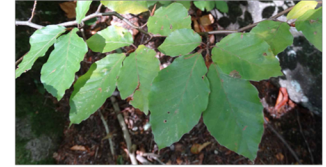
Buk zwyczajny Fagus sylvatica – liście