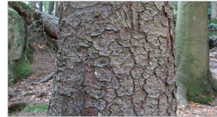
Jodła pospolita Abies alba Mill. – kora