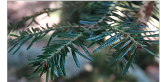
Jodła pospolita Abies alba Mill.