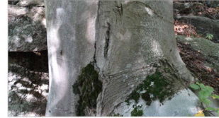
Buk zwyczajny Fagus sylvatica – kora

ry rozciąga się w Karkonoszach na wys. 500-1000 m n.p.m. w naturalnej postaci praktycznie nie występuje. Lasy Karkonoszy były intensywnie eksploatowane w minionych stuleciach. Na miejsce wyrębów, w miejsce gatunków rodzimych, wprowadzono obce genetycznie, zwłaszcza na przełomie XIX i XX wieku. Masowe nasadzenia świerków na początku XX wieku przekształciły naturalne dolneregłowe lasy mieszane w monokulturę świerkowej i modrzewiowej. Ostatecznie monokulturowy las był jedną z przyczyn klęski ekologicznej na przełomie lat 70 i 80-tych XX wieku. Obecnie trwają prace nad przebudową drzewostanu mające doprowadzić, w dłuższej perspektywie, do jego formy pierwotnej. Przebudowa lasu jest prowadzona zarówno na terenie Karkonoskiego Parku Narodowego poprzez działania parku, jak też w jego otulinie przez Nadleśnictwo Śnieżka w Kowarach.