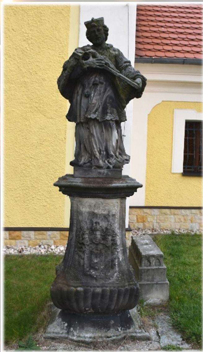
Figura św. Nepomucena przy kościele Św. Trójcy w Podgórzynie

Gmina Podgórzyn, Stowarzyszenie Przyjaciół Podgórzyzna - POGÓRZE, Stowarzyszenie „Ścięgny – moja wieś”.